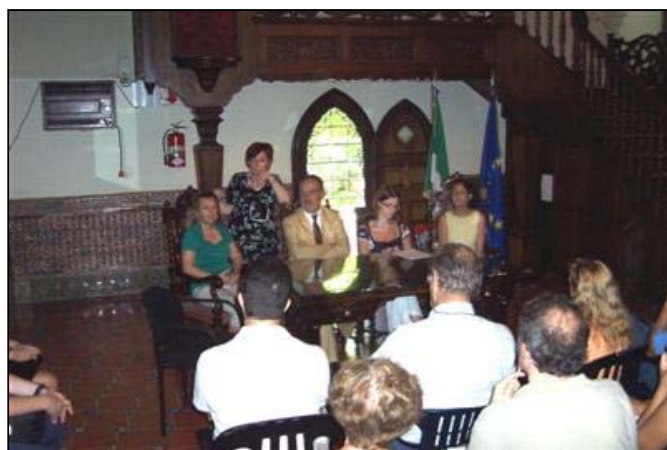
Foto della 2ª riunione informativa svoltasi nella sede del Consolato Generale il 19 febbraio